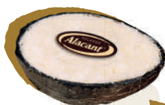
Kokosas / Coconut