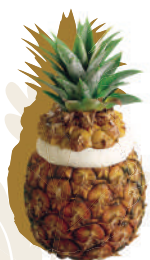
Ananasas / Pineapple