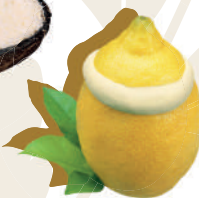
Citrina / Lemon